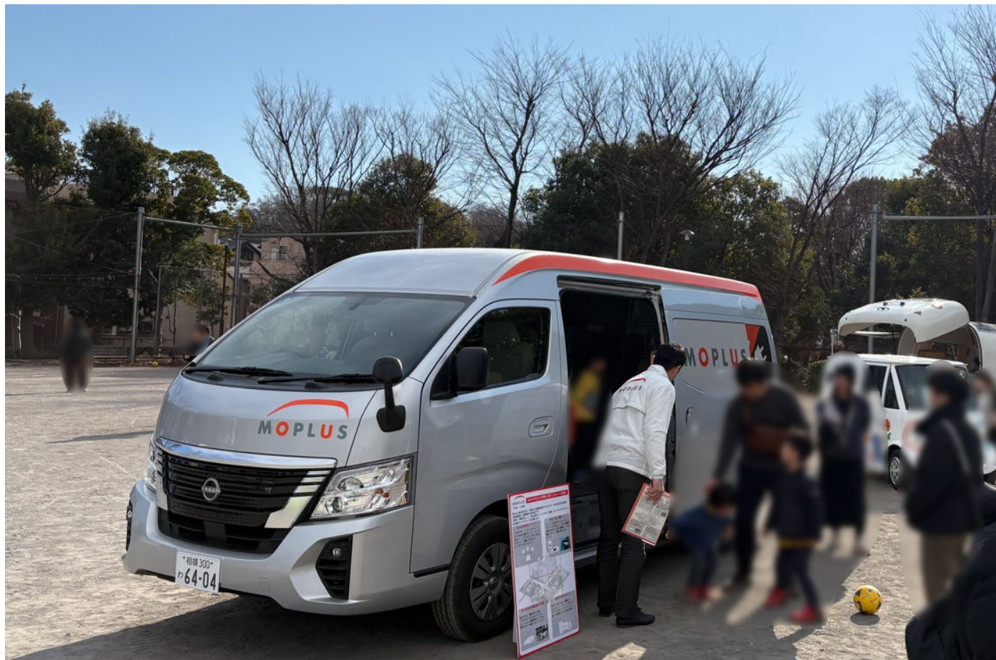
当日の画像(プライバシー保護のため、一部加工しています)

モビリティサービス用 EV を活用した実証等にご興味のある方は、弊社お問い合わせ窓口 (contact@moplus.co.jp) まで、お気軽にご連絡ください。